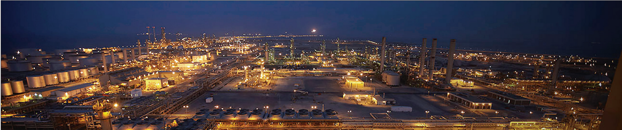
المقر الرئيسي لشركة «أرامكو» في السعودية

تفصيلية عن أداء الحقول يبقى مستمراً، وهو اتجاه تفضل الرياض في الغالب الحفاظ عليه، ويعزز هذا بالتالي من احتمال ألا تصل الصيغة التي ستعتمد لطرح أسهم أرامكو إلى هذا الجانب.