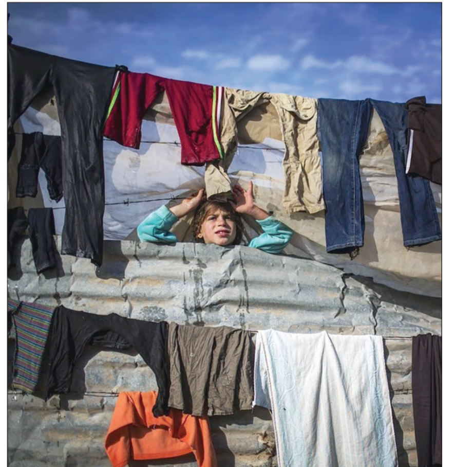
... طالما أن البيوت التي دمرها العدوان الإسرائيلي لم تُبنَ بعد!